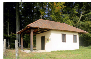
Point vue du Brittlen